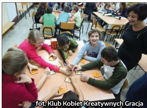
fot. Klub Kobiet Kreatywnych Gracja

Grupa nieformalna „Fani gier” pod patronatem Klubu Kobiet Kreatywnych „Gracja” wpadła na wspaniały pomysł wspólnego spędzania czasu w niedzielne popołudnia na rozgrywkach planszówkami. Celem organizatorów akcji było zachęcenie mieszkańców gminy do wyjścia z domów i wspólnego spędzenia czasu na świetnej zabawie ze szczyptą rywalizacji w tle. Każdy mógł wybrać coś dla siebie z bogatej oferty gier. Rozgrywki odbywały się we wszystkich miejscowościach naszej gminy w budynkach szkół i sądząc po liczbie uczestników zamysł organizatorów został w pełni osiągnięty, a mimo zakończenia akcji jest spore zain-