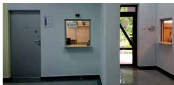
Przebudowany parter Urzędu Gminy