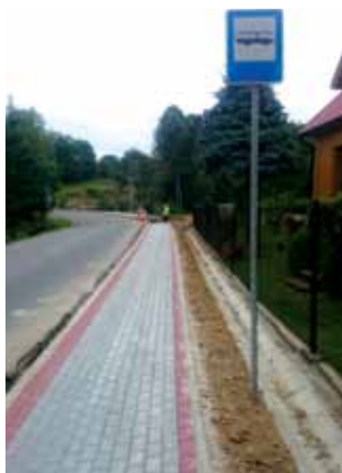
Budowa chodnika w Łękawicy

nia drogi nr 413 – etap II. Prace kosztują 150 tys. zł. Na pierwsze zadanie uzyskano dofinansowanie z programu Małopolskie Remizy w wysokości 20.943 zł.