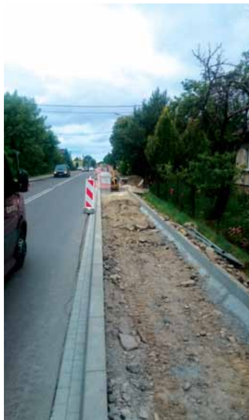
Budowa chodnika w Skrzyszowie

W Łękawicy kończy się budowa trzeciego etapu chodnika o długości 356 m wraz z odwodnieniem. Mieszkańcy będą mogli z niego skorzystać na początku lipca. W budżecie gminnym na ten cel znalazło się 196 tys. złotych. Pod koniec roku planowana jest budowa kolejnego odcinka w kierunku Łękawki,