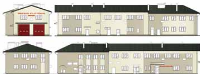
Projekt przebudowy budynku OSP w Skrzyszowie