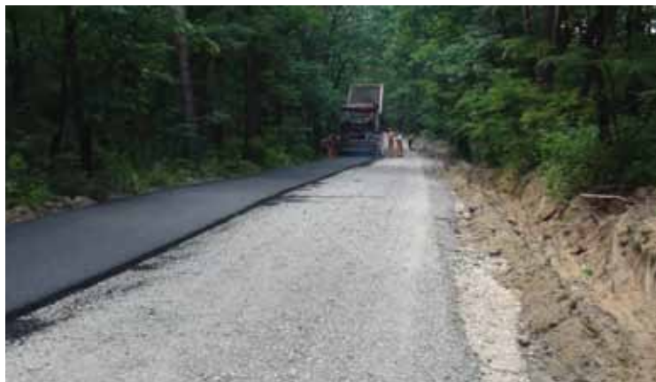
Prace budowlane na drodze Pogórz w miejscowości Pogórska Wola

Pierwsze półrocze upłynęło w gminie Skrzyszów pod znakiem kolejnych inwestycji. Tradycyjnie realizowane były w każdym sołectwie.