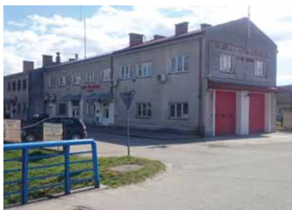
Remiza OSP w Skrzyszowie

Ponadto z myślą o mieszkańcach został przebudowany parter Urzędu Gminy. Od czerwca kasa oraz dziennik podawczy znajdują się na parterze urzędu.