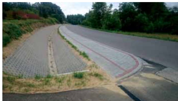
Chodnik w Szywałdzie

Bezpieczeństwo poprawi się w Szywałdzie. Przyczyniła się do tego budowa chodnika wraz z odwodnieniem do skrzyżowania w kierunku Pilzna stanowiąca trzeci etap opracowanego projektu budowlanego. Koszt prac wyniósł 119 tys. złotych, wybudowano prawie 200 m. Dzięki temu brakujący odcinek chodnika wzdłuż drogi powiatowej pomiędzy Skrzyszowem i Szywałdem został uzupełniony. W drugiej połowie roku kontynuowana będzie budowa ścieżki rowerowej w kierunku Zalasowej. Na ukończeniu są prace projektowe ostatniego odcinka, który w całości zakończy budowę ścieżki wzdłuż drogi powiatowej przebiegającej przez tę miejscowość. Budowa ostatniego odcinka podzielona będzie na 3 jednoroczne etapy, w roku 2016 roku powstanie pierwszy odcinek kończący się przy zakonie Sióstr Służebniczek.