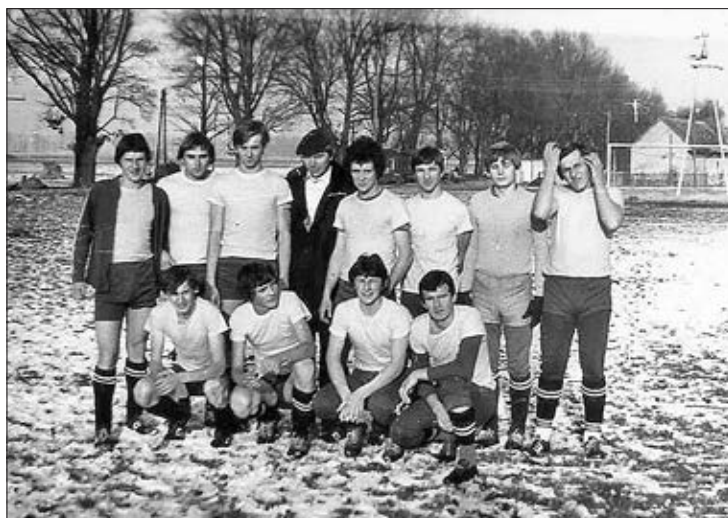
Drużyna piłki nożnej z 1981 r.

LKS Szynwałd to najstarszy klub sportowy w gminie Skrzyszów. W tym roku obchodzi trzydziestopięciolecie swojej działalności. Z całą pewnością działacze LKS Szynwałd zasługują na uznanie, bo mimo różnych zawirowań społeczno-politycznych udało im się nie tylko utrzymać klub, ale równocześnie wzmocnić jego renomę.