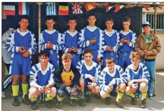
Piłkarze z Szynwałdu we Francji w 1995 r.