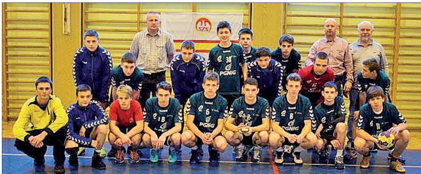
Zespół sportowy LUKS z gimnazjum w Skrzyszowie.

Z sentymentem będzie wspominał nauczycieli z gimnazjum w Skrzyszowie, którzy - jak mówi - potrafili dostrzec jego wyjątkowe zdolności i pomogli mu je rozwijać.