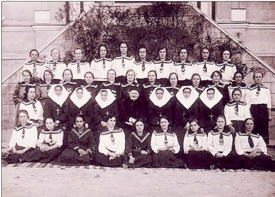
Zakończenie roku szkolnego