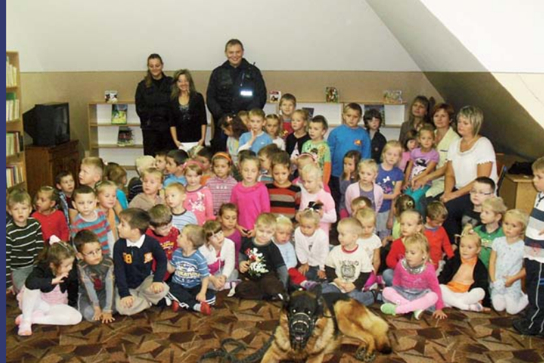
Światowy Dzień Zwierząt w Bibliotece Publicznej w Łękawicy