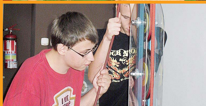
Wycieczka do Ogrodu Doświadczeń i Muzeum Inżynierii Miejskiej w Krakowie