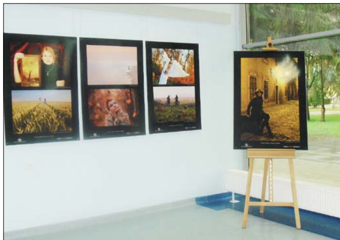
FOT. E. PLANETA (3)